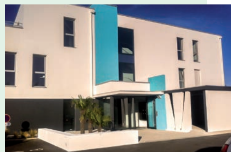
> Espace Océan - 17 rue du Danemark - AURAY

repérables puisqu'ils jouxtent la caserne des pompiers d'Auray.