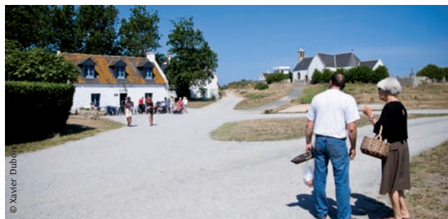
> Discussion matinale au cœur du village d'Hoëdic