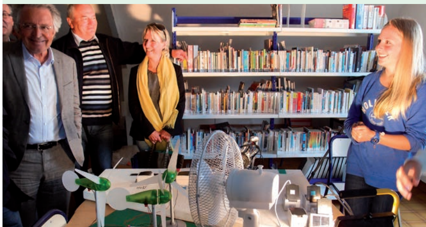
> Houat, le 17 mai 2013 : présentation de la maquette par les collégiens de Houat-Hoëdic

leur reportage pédagogique autour du projet ADDRESS. Pour faire leur vidéo, les collégiens ont dû décortiquer le fonctionnement du système expérimental mis en place chez les habitants et analyser les enjeux de la gestion des énergies renouvelables et de l'électricité sur une île.