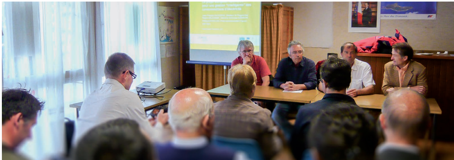
> Hoëdic, le 19 mai 2011 : Conférence de presse pour le démarrage du projet ADDRESS

L'expérimentation du projet européen ADDRESS a pris fin le 31 mai 2013 suite à 7 mois de tests auprès des habitants de Houat et Hoëdic.