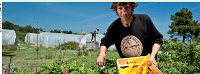
> La ferme aromatique de Belle-Île

Il se déroulera à Groix les 10 et 11 octobre prochains.