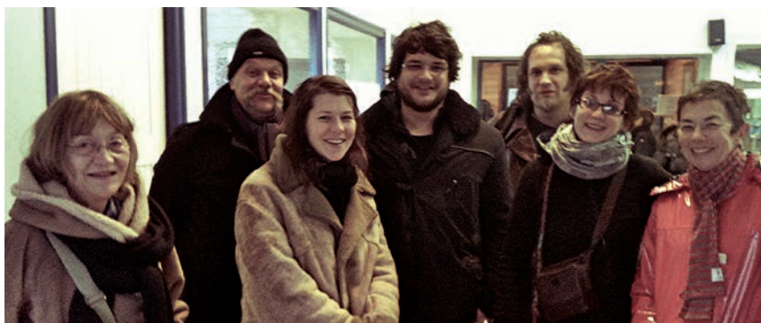
> Les représentants des 6 associations sont venus présenter leur projet lors de l'AG 2013 à Molène