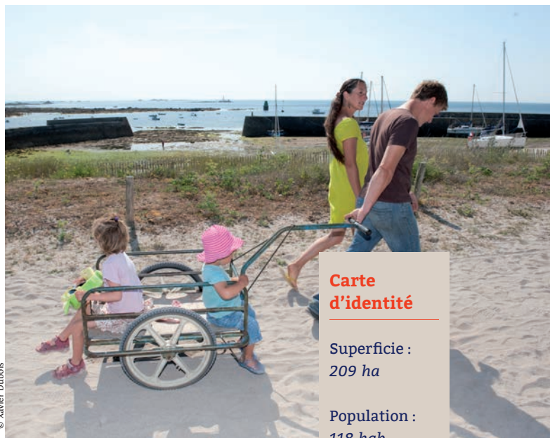
> Hoëdicais en promenade