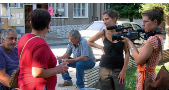
> Les Tempestaires en tournage

* Les Tempestaires (Belle-Île), Le Festival International du Film Insulaire de Groix et Cinéph'île (Groix), Daoulagad Breizh (Sein, Ouessant, Molène), le 7 e Batz'Art (Batz), Oya Films (Yeu)